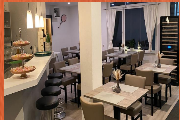
Ristorante il Campo