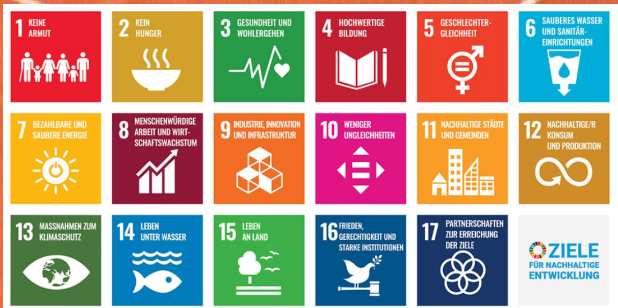
Die UN Nachhaltigkeitsziele

Um die Ermöglichung der sportlichen Entfaltung innerhalb einer intakten Gemeinschaft gewährleisten zu können, mit den uns als Verein gegebenen Ressourcen, ist Nachhaltigkeit in mehrerlei Hinsicht die Basis unseres Handelns. Dies wird auch durch einen Blick auf die UN Nachhaltigkeitsziele deutlich, die wir als gemeinnütziger Verein naturgemäß unterstützen.